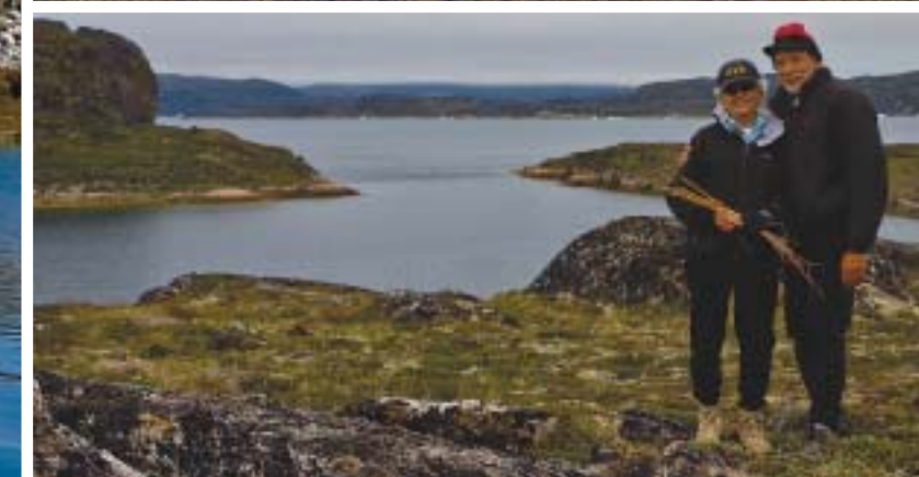
Plovidba do Irske bila je izrazito teška, toliko da su se Dashewovi morali vezivati za krevete, ali su zato sve nadoknadili uživajući u njezinim prelijepim krajobrazima

suzno za brod od 25 metara koji bi u svakoj drugoj izvedbi imao najmanje 5 kabina i ku-paonica.